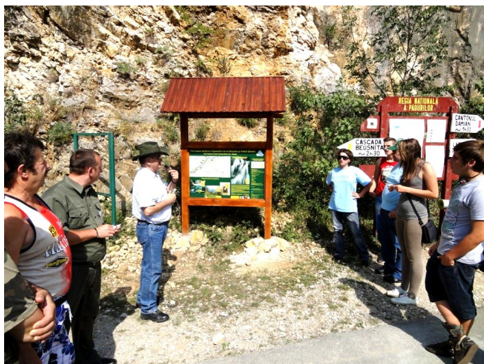
Podul Beului - punctul de plecare pe poteca tematică.

În cadrul implementării proiectului a fost instituită data de 5 iunie, ca Zi a Parcului Național Cheile Nerei - Beușnița și a fost realizată poteca tematică „Prin lumea mirifică a legendelor de la Beușnița și Ochiul Beului”.