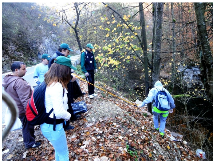
Igienizarea albiei pârâului Miniș în zona cascadei Bigăr

Programul de voluntariat mai include și campanii de informare și sensibilizare a populației locale și a grupurilor de turiști privind nevoia respectării regimului de protecție și conservare a acestor zone precum și igienizări ale zonelor de protecție integrală incluse în aceste parcuri.