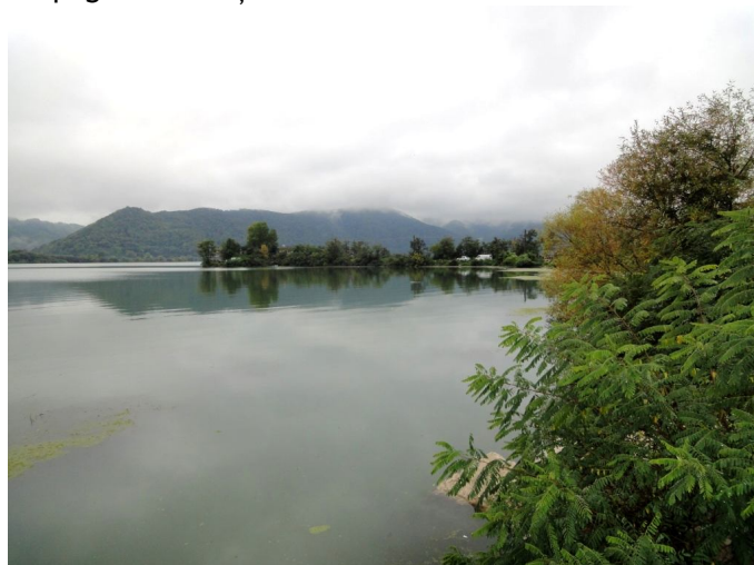
Ocuparea albiei minore a Dunării, o activitate ilegală frecventă pe teritoriul comunelor Berzasca și Șvinița.

Și după aprobarea planului de management administrația parcului nu va putea face o corectă activitate de protecție și conservare pe terenurile private deoarece, această activitate este una guvernamentală iar Guvernul trebuie urgent, să hotărască dacă expropiază pentru cauză de utilitate publică terenurile incluse în zonele de protecție integrală sau administrația parcului încheie cu fiecare deținător de teren, în aceste zone, un contract de protecție și conservare cu o corectă despăgubire a deținătorului.