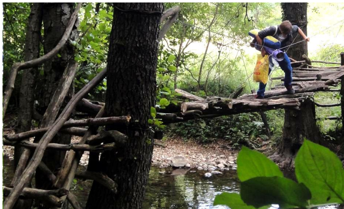
Etern avariata punte ONE BY ONE de la Prolaz

În zilele de 16 și 17 august 2013 GEC Nera, a realizat o monitorizare a stării factorilor de mediu și a biodiversității de pe teritoriul comunei Carașova, pe un traseu ce a inclus Cheile Carașului din interiorul Parcului Național Semenic - Cheile Carașului.